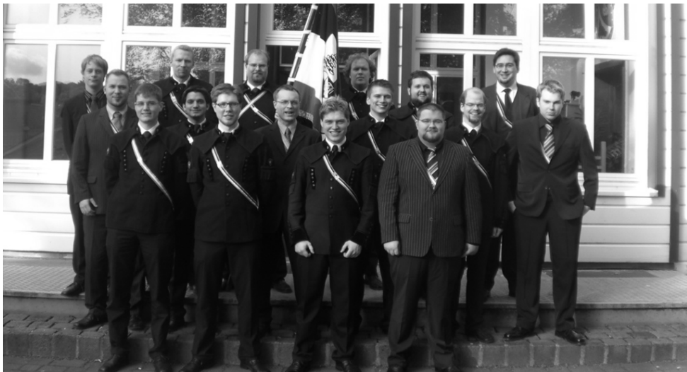
Aufgenommen im April 2009.