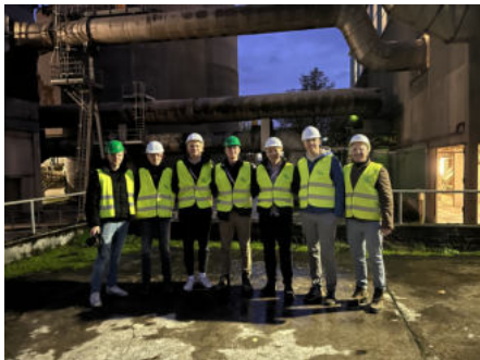
Exkursion zu HeidelbergCement